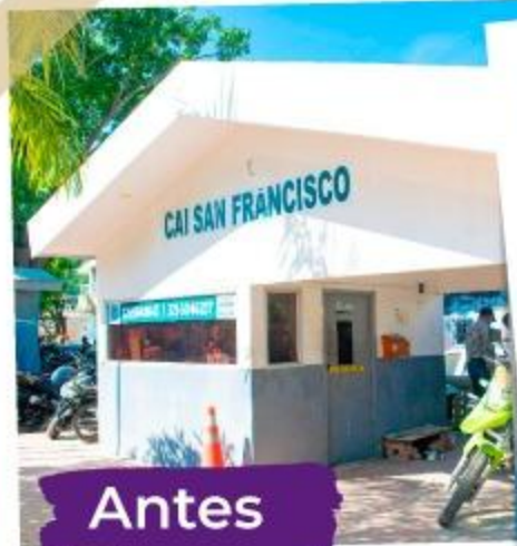
CAI San Francisco

En ejecución: Los Ejecutivos, Crespo, María Auxiliadora, El Laguito, El Bosque, El Pozón y Fredonia.